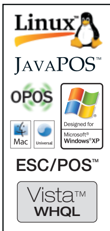
Kompatibilität mit den meisten wichtigen Betriebssystemen