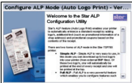
Leicht bedienbares AutoLogo™ Tool mit der Fähigkeit bis zu 15 Grafiken oder Coupons zu konfigurieren / downloaden, ohne das teure Software-Änderungen oder komplizierte Einstellungen erforderlich sind, dank einer einfach bedienbaren assistenzgestützten Software. Die gewünschte Grafik wird aufgeladen & identifiziert und anschließend werden die relevanten Coupons oder Grafiken ausgelöst