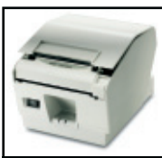
Bündig abschließende Kanten für neues spritzwassergeschütztes es Design