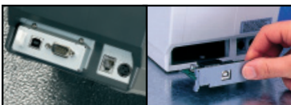
Es sind Modelle mit seriellem, parallelem und USB-Anschluss sowie eine schnittstellenfreie Version zur Verwendung mit Ethernet oder WiFi erhältlich