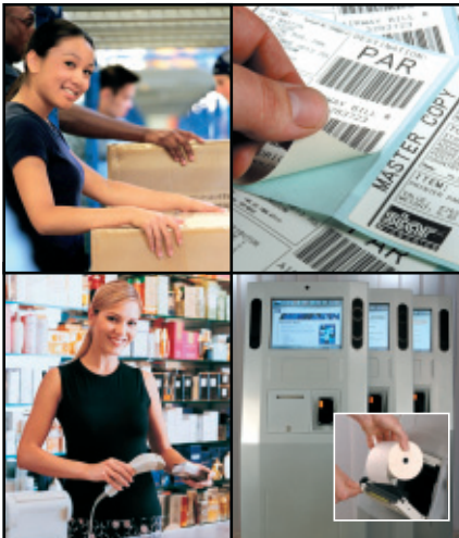
Multifunktionaler Hochgeschwindigkeitsdrucker, ideal für Etiketten, Barcodes, Tickets und Kioskanwendungen