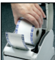
„Drop-In & Print“ Einfache Papierhandhabung